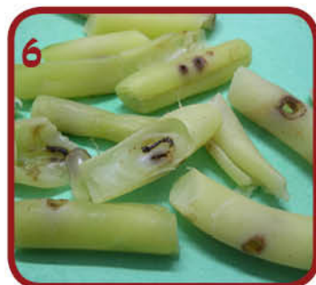
6 זחלים בלוביא