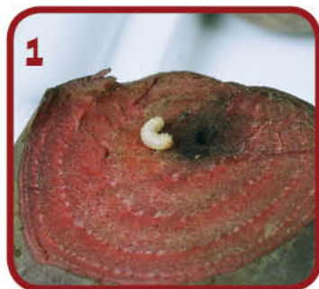
1 עש הסלק