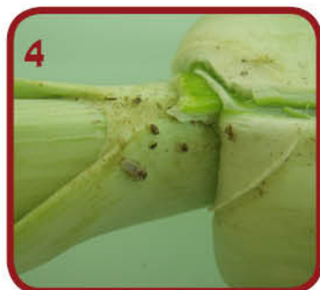
4 חרקים בלוף