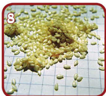
8 זחלים בשומשום