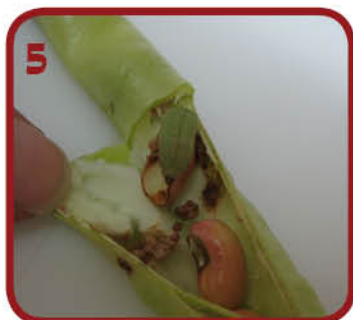
5 זחל בתרמיל לוביא