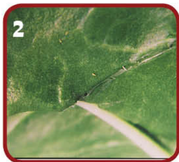
2 טרימפסים בעלי סילקא