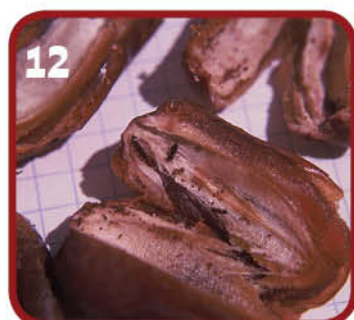
12 תמרים נגועים