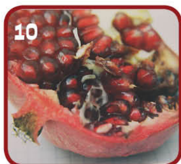
10 זחלים ברימון