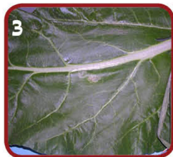
3 זבוב המנהרות בעלי סילקא