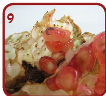
9 כחליל הרימון