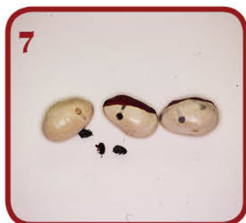
7 זחלים בשעועית