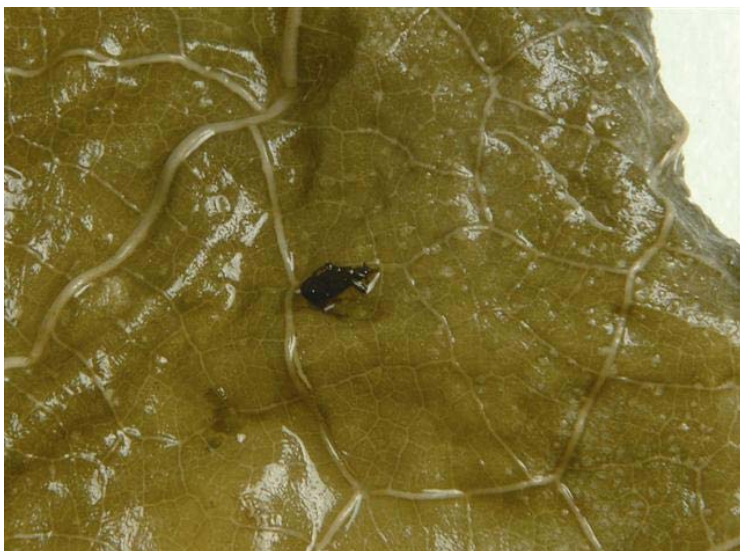
ציקדה שנמצאה בעלי גפן שהגיע לארץ עם כשרות מהודרת