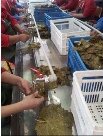
מפעל ייצור, מצד ימין ללא פיקוח המכון ללא ברזים, מצד שמאל ייצור מיוחד תחת הפיקוח שלנו, עם ברזים שהותקנו במיוחד על ידי מומחי המכון, לייצור ללא חרקים