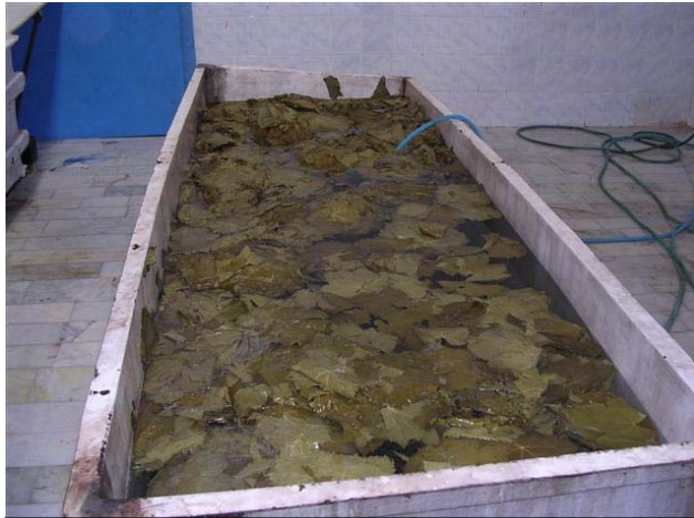
השרייה רגילה במפעל ללא כשרות, מושרה בחבילות וללא הפרדה בין העלים

בחבילות, ומשם יוצאים לעיבוד – ההליך הנז' איננו יעיל כלל, עד כדי כך שלעיתים כאשר מכניסים את היד לאמצע החבילה, מרגישים יובש מוחלט, כאילו העלים לא הושרו חודשים בחבית ולא עברו בבריכת השריה.