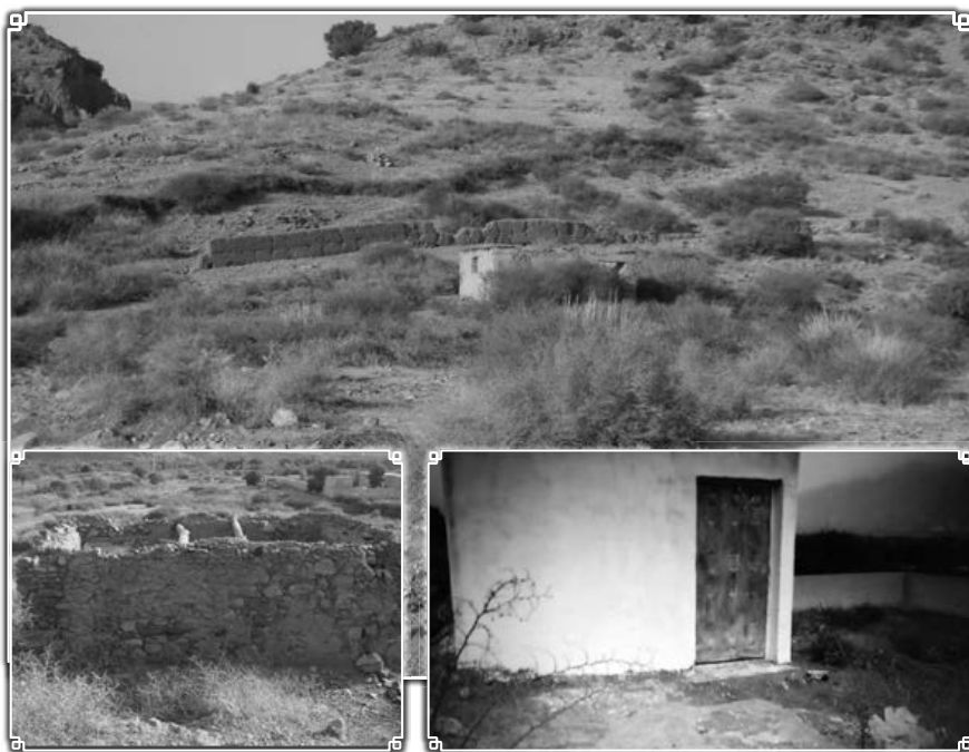
תמונה כללית של בית העלמין עם שאריות החומה הישנה, באמצע בית העלמין ציונו של רבינו זיע"א ובתמונה הקטנה משמאל ציונו לפני השיפוץ. בתמונה הקטנה מימין ניתן להבחין בחומה החדשה ובמבנה החדש שהוקם על ציונו

רבי יעיש "הקטן" נפטר בליל שבת קודש יז טבת בשנת תרצ"ט, ומנוחתו כבוד בבית העלמין ב"אולד ברחיל" סמוך ונראה לציון הקדוש של רבינו דוד בן ברוך זיע"א.