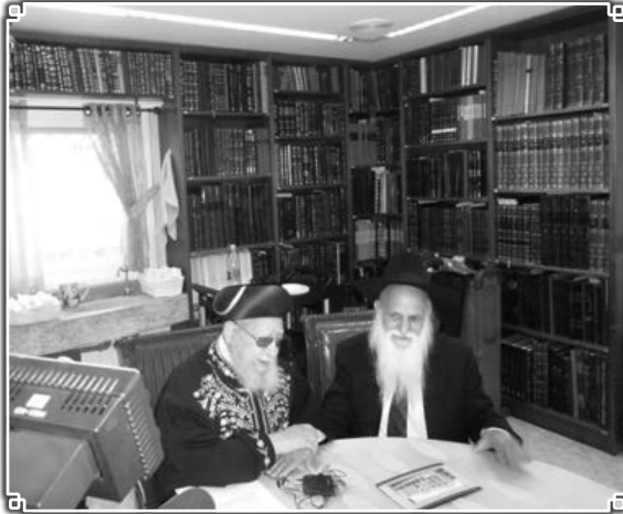
חור אבי שליט"א אצל מרן רבינו עבדיה יוסף זצ"ל בבואו להזמינו לחנוכת הבית של הישיבה באלעד

מתוכו דיינים חשובים אבות בתי דין, ורבנים חשובים ביותר, שינקו מכוחו ומכוח התורה שהייתה במקום. באותם ימים שיד המסיון הארור והידוע