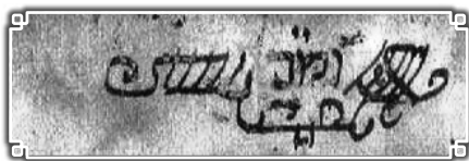
חתימתו של רבינו זיע"א

זכות הצדיק תעמוד לנו וימליץ טוב בעד כל צאצאיו בכל מקום שהם, ומו"א שליט"א ומרת אימי שתחי' בתוכם, שיזכו לראות פני משיח צדקנו מתוך בריאות, קלות ונחת מכל יוצ"ח, דשנים ורעננים יהיו עד ביאת גוא"צ ועד בכלל.