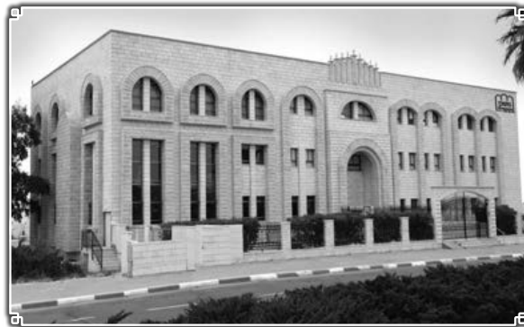
בנין הישיבה עומד על תילו בעיר אלעד

עם תחילת בניית העיר אלעד, מו"א שליט"א חזה ברוחו שהמקום והעיר עתידה להיות מקום תורה הראוי לבני תורה, והחל יחד עם שותפו לעשייה